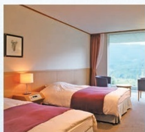
◆洋室(ツインタイプ)