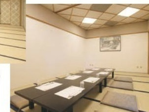
◆小上がり個室(4～8名様)