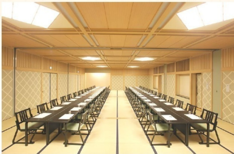
天空の宿 やまのれん

※少人数でのご利用も承っております。 食事のみや、偲ぶ会の会食等 お気軽にご相談下さい。