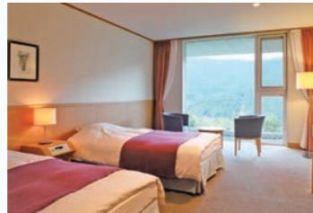
◆ 洋室(ツインタイプ)